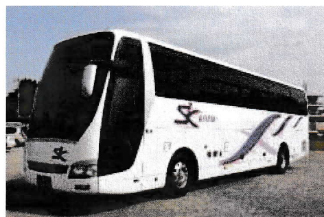
バスの外観（エスケー交通）